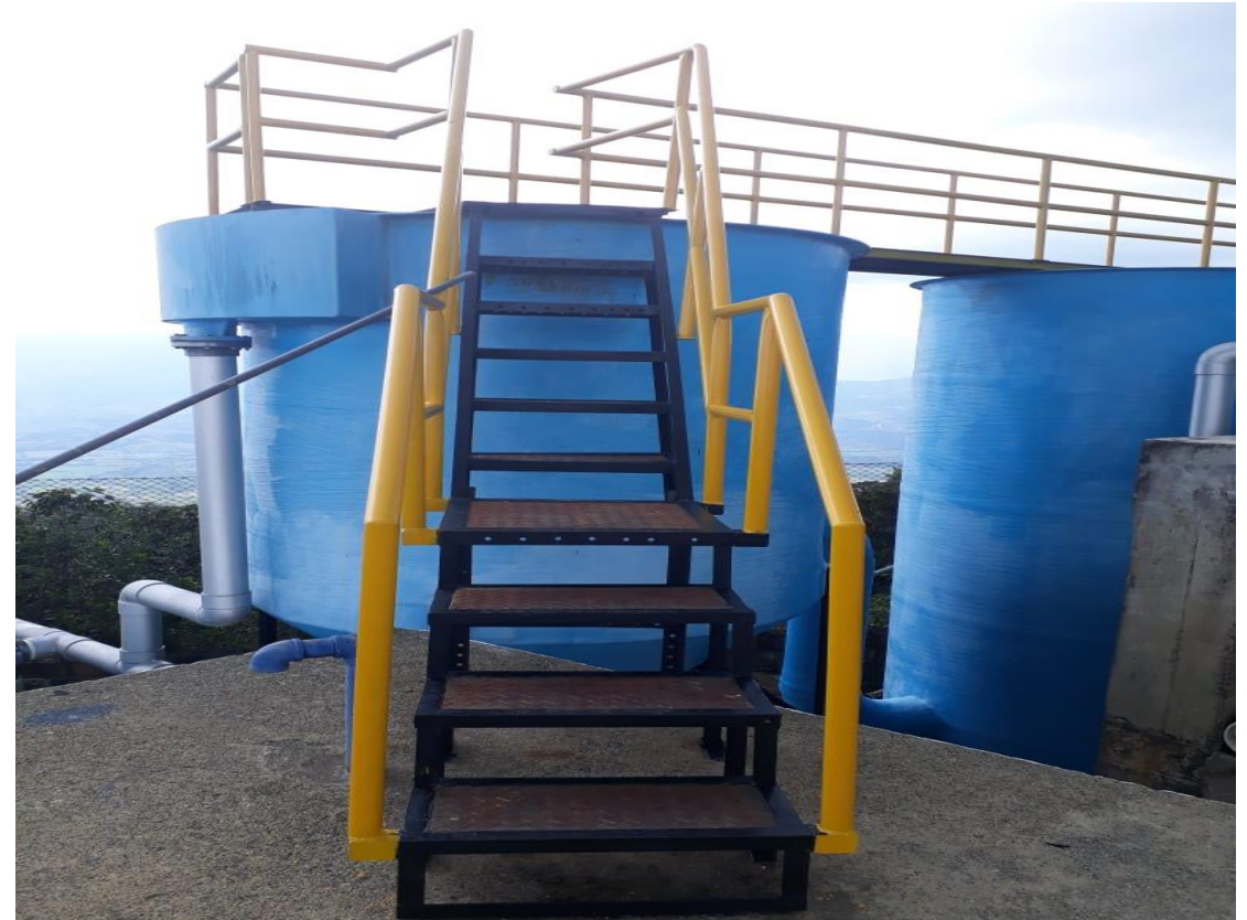
Planta de Tratamiento San José

La Empresa de Obras Sanitarias de Caldas “EMPOCALDAS S.A E.S.P” es una Sociedad Anónima Comercial de Nacionalidad Colombiana, del orden Departamental, clasificada como empresa de servicios públicos, con autonomía administrativa, patrimonial y presupuestal, que se rige por lo dispuesto en la Ley 142 de 1994 y la Ley 689 de 2001.